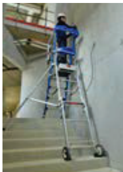
Installation en dénivelés.